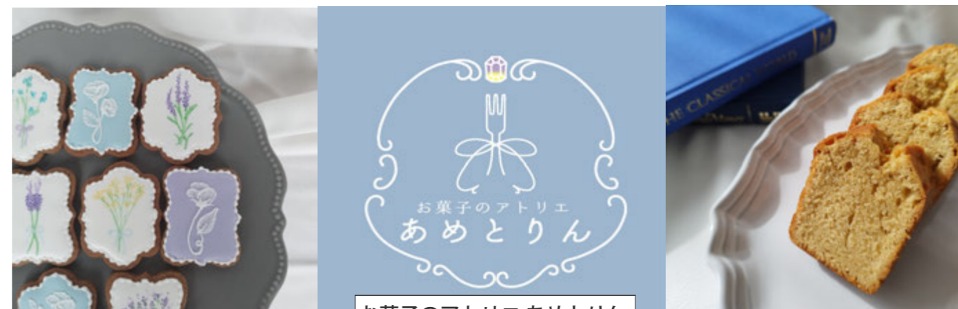
お菓子のアトリエ あめとりん

【はままつ起業家カフェとは】 浜松市、(公財)浜松地域イノベーション推進機構、浜松商工会議所の3支援機関の協同により、浜松商工会議所会館1階に設置するはままつスタートアップの創業支援総合窓口です。