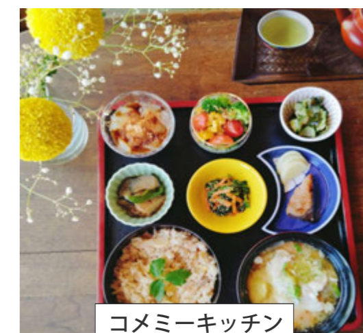
コメミーキッチン