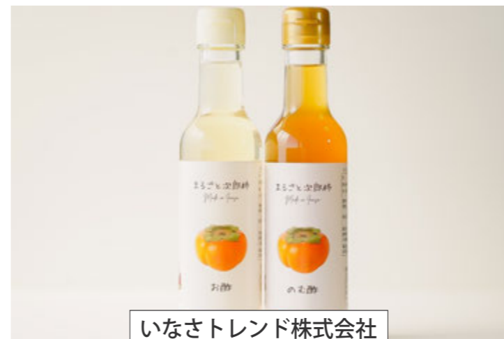
いなさトレンド株式会社